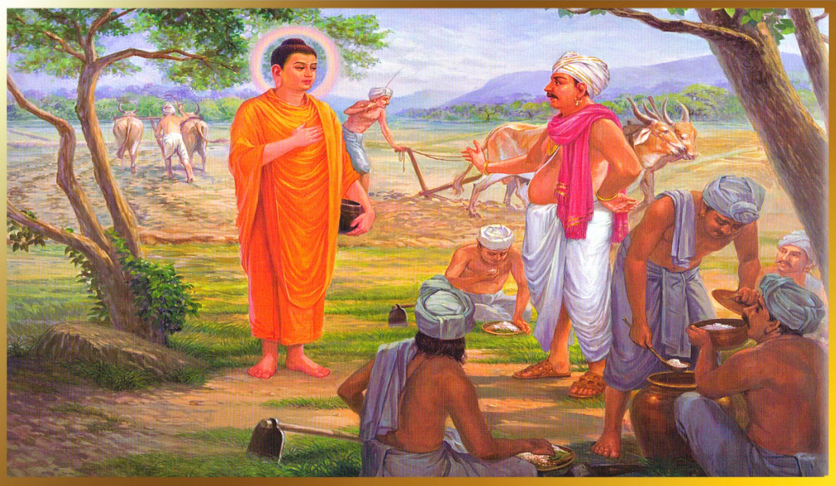
56. Gieo trồng mảnh đất tâm linh

Đời sống chánh mạng khát thực của hàng sa môn đôi khi khiến một số người nghĩ rằng Đức Phật và các đệ tử xuất gia đi tu vì không thể tự lực sinh nhai. Với hình ảnh giản dị của một sa môn khát thực Đức Phật ít khi nhắc cho dân gian biết rằng bản thân của Ngài từng là một vị quân vương sống trong cung vàng điện ngọc vì hướng cầu giác ngộ giải thoát nên từ bỏ tất cả. Nhiều người dùng thước đo của danh lợi để đánh giá cuộc sống bởi vì không hiểu được giá trị của cuộc sống tinh thần.