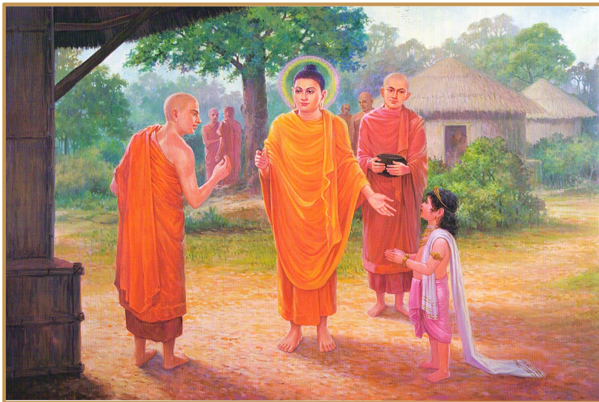
38. Con vua thì kế nghiệp cha

câu chuyện của sa di Rāhula trở thành hình ảnh tiêu biểu cho sự giáo dục tinh thần đối với tuổi trẻ nhiều thế hệ cho tới ngày nay.